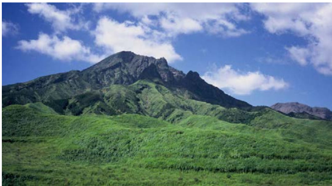
阿蘇高岳（北東方面から）