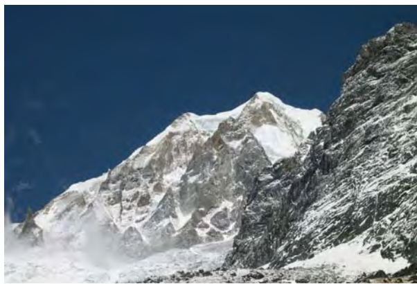
ブンギ南壁 6538 m N 28 33 16 E 84 29 09 マナスルの西、約7Km、1971年日本マナスル西壁登攀隊(隊長高橋照)東京都岳連の精鋭が頂上北西面の難渋の連続と困難なルートから頂上プラトーにキャンプ5設けた。ここから南西に尾根が続き、新解禁峰/未踏峰 ツラギ・ピーク7059m N28 31 40 E84 31 22から北西に稜線が、このブンキ峰へと・・・。ドゥード・コーラの北面、ドメン・コーラ側、ラルキャ・ラへの路、ビムタンのテント地から見る北面は『三本槍』と称する岩峰が屹立している。

ここ数年ネパール観光省は魅力ある未踏峰の解禁を発表した。これらの山々を紹介して行きたい。今回はマナスル周辺の興味ある地域を・・・。 関西人に馴染みの深いマナスルやP29、それにヒマール・チュリなど以外はあまり知られていない。 昨秋、日本山岳会学生部の若い人達が初登頂に成功したパンバリ峰六九〇五m (N28 43 08 E84 29 05) 彼