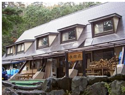
こもれび荘 (旧長衛荘)