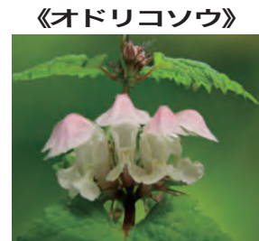
(シソ科オドリコソウ属)

オドリコソウは、北海道、本州、四国、九州及び、韓国、中国に分布。環境の範囲は幅広く、人里や草地の林縁に多く観られる多年草。高さは30～50cmくらいになる。葉は対生、その形は卵状三角形から広卵形で上部の葉は卵形で先がとがり、縁は粗い鋸歯状になり、基部は浅心形で葉柄がある。▼花期は4～6月で、唇形の白色またはピンク色の花を、数個輪生状態になって茎の上部の葉腋に数段につける。▼山地の林のなかで見られることもある。▼花の形が笠をかぶった踊り子の姿を思わせることが名の由来。▼花の色は淡紅紫色と白色があり、地域によってだいたいどちらかに決まっており、両方が混生することは稀である。