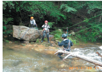
「斜張り」による事故者の搬送

まず沢という独特な場面における▼アンカーの設置。▼立木へのメインロープのフィックス。▼メインロープによるインラインフィギアエイトを使用した流動分散。▼岩を使ったアンカー「石八」(石屋さん)が石を運ぶ時に使う方法を応用したやり方)等を行い、次に1/3システムによる斜張り。これも沢レスキューでは必携。最近では9ミとか8・5ミといったロープを使用される事が多いと思います。しかし10・5ミや11ミなどのロープに比べるとこれら