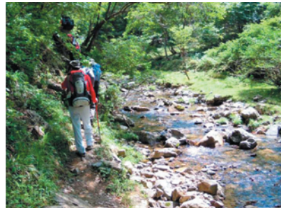
夫婦滝から汁谷へ せせらぎ治いのメルヘンな道

京阪出町柳駅集合～坊村～三の滝～牛コバ～夫婦滝～汁谷～木戸峠～天狗杉～JR滋賀駅解散