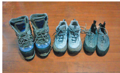
左から積雪期用、ハイキング用、クライミング用

登山の内容により最適の1足が有りますので少なくとも次にあげた条件を考慮して選んでみて下さい。