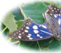
国蝶オオムラサキ