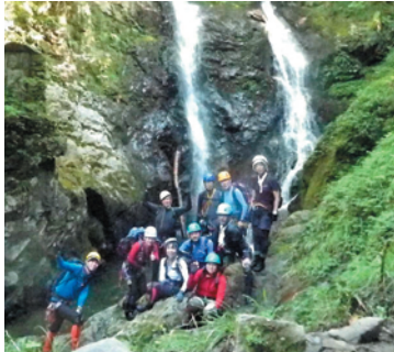
遡行終了 夫婦滝にて(北山)

【参加者】天気もよく水温もそんなに低くなくて気持ち良かったです。入門コースとの事でしたが、思ってたよりも岩登りの箇所が多かったように思いました。