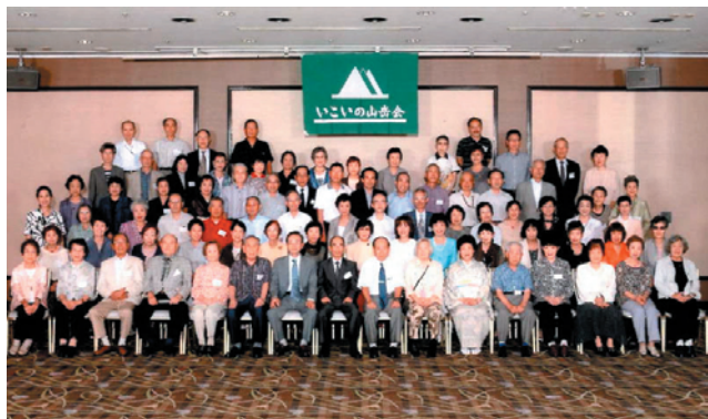
2011年5月 50周年記念祝賀会

心に日本アルプスや全国の山域、海外を活動範囲にしており、会員は40歳以上の方を対象にしていますが、一般登山のほか、沢登り、ハイキング、古道歩き、スケッチ、俳句、写真やスキーなどを実施し、中高年の多くの方に楽しんでいただいております。雑誌や新聞で40歳以上の人達のユニークな山岳会として紹介されたこともあります。