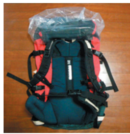
ザックの大きさより少し大きいぐらいのビニール袋