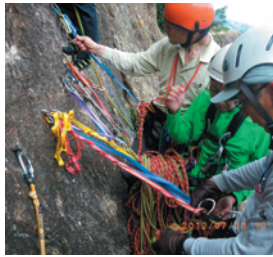
ビレイの基本動作の確認

参加者17名。蓬萊峡にて初級A班・B班・中級班に分け各班の実力に応じた岩登り練習。初級班は主にトップロープで、中級班はペアを組んで練習し、動作や手順でおいしいところを修正しながらクライミングの基本的な流れをしっかりと学習した。