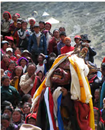
チベット仏教徒の仮面舞踏(チャム)

計画のはじまりは、西北ネパール・トルボ地方で2012年(龍年) 12年に一度に行われるチベット仏教徒の巡礼祭の話であった。チベット暦7月の満月の日に行われるという。巡礼祭が行われるなかでも最も奥地にあたる上トルボにある。聖山の名前はシエー山(シエーリウオドゥクダ山の略。龍が鳴く水晶山の意。河口慧海師はセー山と呼んでいたそうだ。シエー・ゴンパには3つの僧院がある。河岸段丘に建てられているシエー・スモド・ゴンパ。そこでお祭の行事が行われた。巡礼者たちは一番いい衣装をまとい、着飾っていた。私たちが私の母の形見である着物をリメイクして持つ