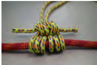
D. プリッジブルージック