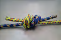
A. ダブルフィッシュヤーマンズノット