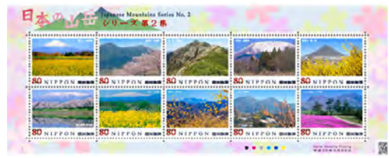
日本山岳切手シリーズ第2集 上段左から(1)富士山・静岡県 (2)筑波山・茨城県 (3)笠ヶ岳・岐阜県 (4)伊吹山・滋賀県 下段左から(5)飯野山・香川県 (6)蔵王連峰・宮城県 (7)月山・山形県 (8)両神山・埼玉県 (9)二上山・大阪府 (10)くじゅう連山・大分県 (1シート10枚)

日山協前会長田中文男氏の助言監修で日本の山岳切手が発行されたのが、23年の9月。今回が第2集。各都道府県から一つの山が選ばれる。大阪は二上山。大津皇子の悲運で知られ、全国的に有名な山であるが、山としては里山低山。2012年3月11日太子町春日(春日墓地上部)より。前面は梅の木。