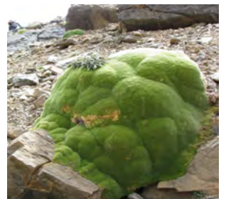
ナデシコ科ムア・アトン

それが終わってから、高僧たちは高山植物から作った漢方薬を並べて、巡礼者たちを順番に脈診をし、症状にあった漢方薬を与えていた。高僧たちはチベット医(アムチ)である人も多い。