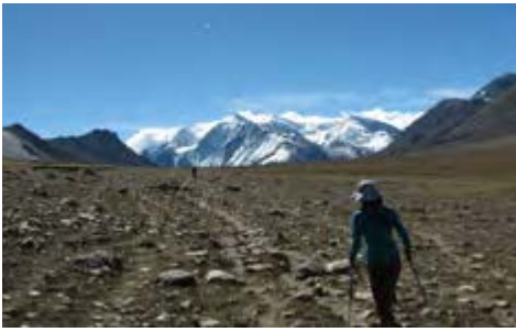
トジェ・ラ(峠)手前 ターシカンが見える

9月15日、稜線に出るとい ろんな白い山が見えた。あれ もこれも登れるのではないかと、 誰もいない大雪原を歩いて 気持ちよかった。標高 6042m、無名峰最高。ピー ク標高6089m立ち、標高 6072m手前で天気が悪化 してきたのでそそくさとハイ キャンプに下っていった。無 事に全員がツアルカ村に戻っ たときはほんとに安堵した。