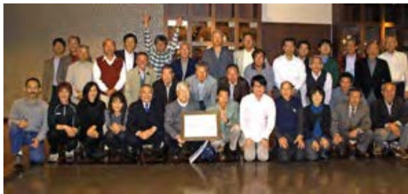
大阪同窓山岳会 50周年記念集会 2010年11月

や鳥海山から四国・剣山、久住山などに登り、花を追いかけて、風景を楽しみ、温泉に浸るという感じです。登るだけでなく、いろいろな楽しみを盛り込み、近郊ハイクでも例えれば春の歌垣山のすき焼き、金剛山での天ぷらは恒例となっております！(山頂で鍋を囲んで宴会モードのグループが居れば私たちがも・)現在の会員数は京阪神から播磨地区在住の24名、約4割が女性です。 年齢構成は34〜58歳、新入会員は40歳までとして随時募集しております。