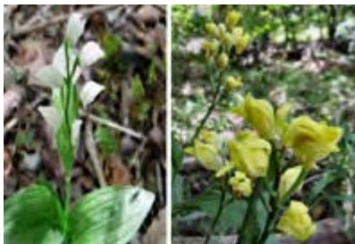
(ラン科キンラン属)