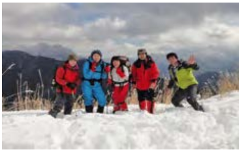
2012年2月 大峰・観音峰

山行スタイルは縦走を主体に「自主、安全、自由」を重ししながら、各メンバーが余暇を楽しみ、自然と戯れております。 日頃は金剛山や六甲山、北摂周辺の日帰り登山、そして遠征と称して日本アルプスや全国各地の山々の縦走を行っております。最近では道東三山