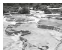
▲石灰岩と水がつくった自然の造形・黄龍

観光庁長官登録旅行業第490号(第1種)/一般社団法人日本旅行業協会 正会員 © 日本山岳保証協会 ALPINE TOUR SERVICE 株式会社